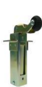
Dictator 1500 VS