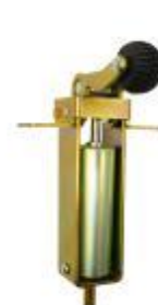
Dictator Standard ESP