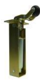
Dictator Ceita 24R