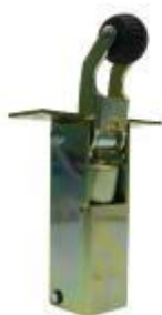
Dictator 1500 OT