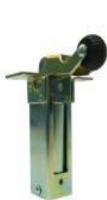
Dictator 1500 BS