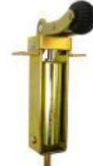
Dictator F 30R