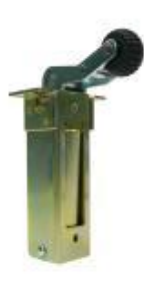
Dictator 1500 SH