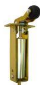
Dictator 1500 MLN